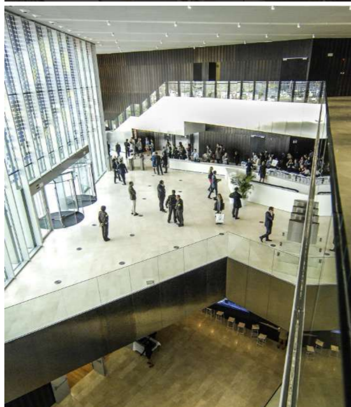
SEDE OAMI- ALICANTE J / EDDEA