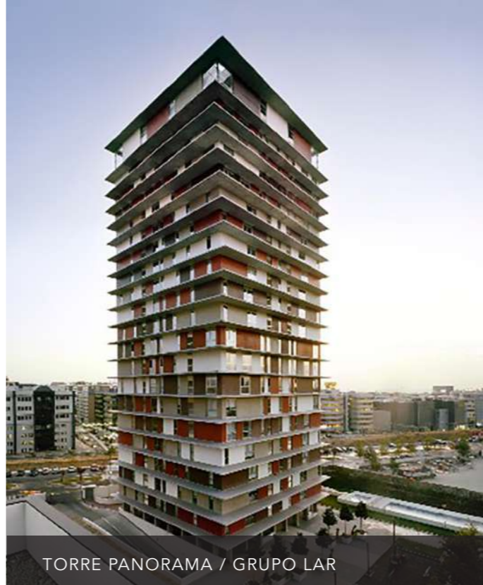
TORRE PANORAMA / GRUPO LAR

EDDEA is a leading Spanish firm practicing Strategic Urban Design and Planning, Architecture, Construction and Project Management. We find our way throughout Design, Technics and Business. We work to create the conditions for a new dialog between Society, Nature and Economy, through a holistic development targeting strategy.